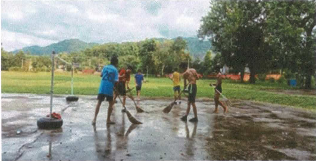
ลานกีฬาบ้านห้วยขี้เหล็ก หมู่ ๑ ต.ป่าซาง อ.เวียงเชียงรุ้ง จ.เชียงราย