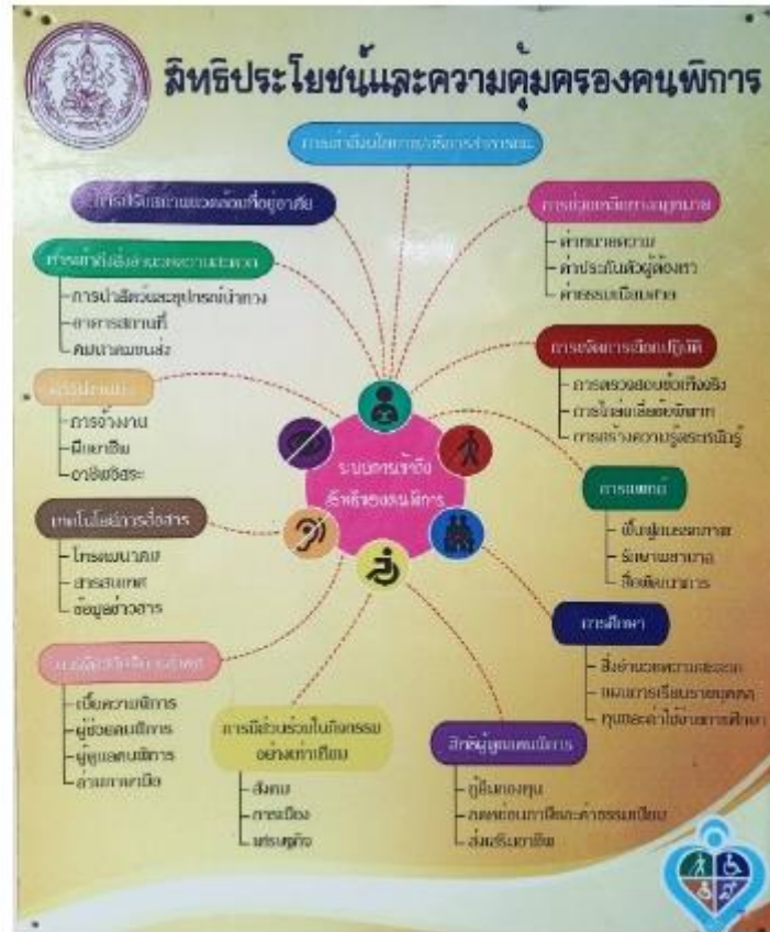
5.เผยแพร่ประชาสัมพันธ์ข่าวสารที่เป็นประโยชน์แก่คนพิการ